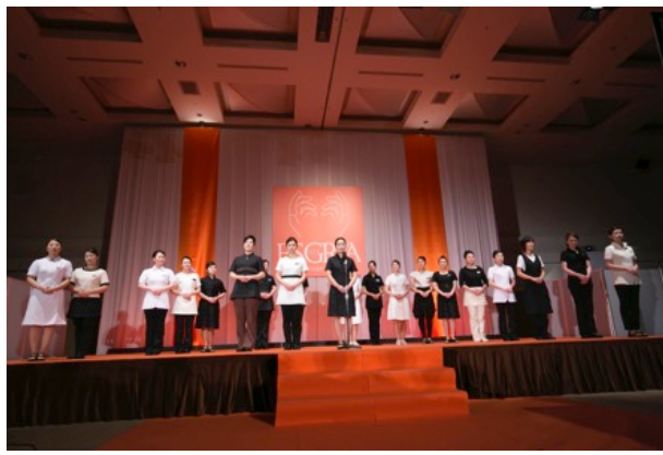
■4/13フェイシャル技術部門セミファイナル(ファイナル出場者発表の様子)