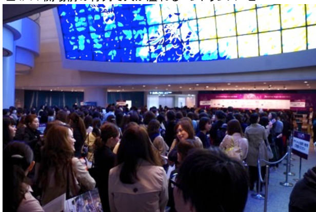
■4/14 開場前の行列で人が溢れるエントランスロビー