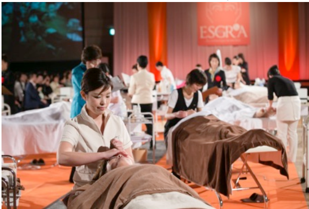
■4/13フェイシャル技術部門セミファイナル(競技中)